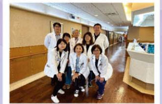
乳房外科照護團隊