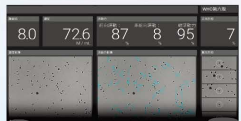
高階精子型態分析：以光學攝像鏡頭連續觀察精蟲形態，依精蟲大小、活動狀態判斷得出精子的關鍵參數，如濃度、活動力、頭頸部形態