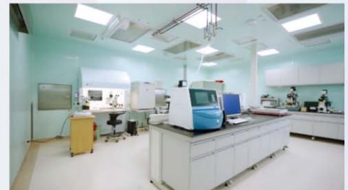
胚胎實驗室設備：胚胎實驗室採用ISO 7等級，潔淨度為class10K